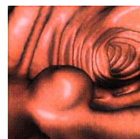
仮想大腸内視鏡像