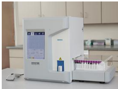
血球計数装置「アドヴィア 560」