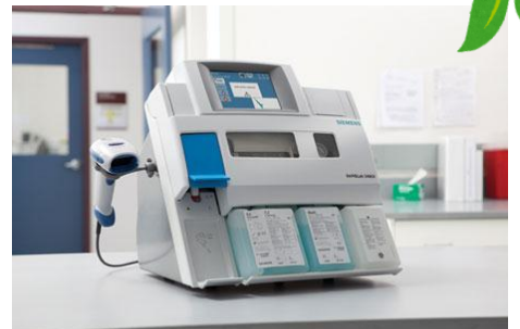
血液ガス分析装置「ラピッドラボ 348EX」

平成29年4月より従来の検査体制を一新し、院内検査の充実、迅速化を図ることになりました。