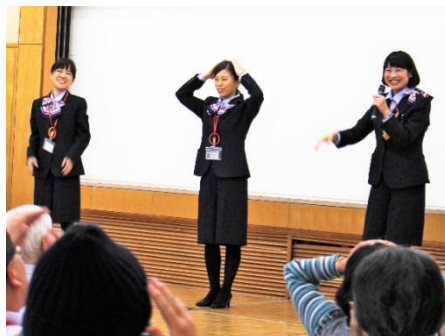
脳活性体操 ヤクルト本社の皆さん